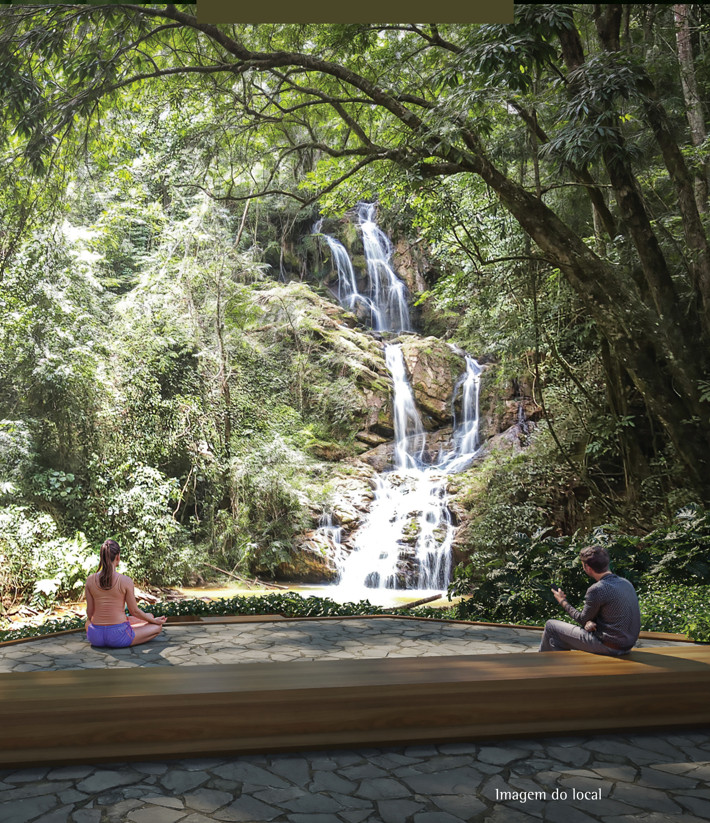
Imagem do local

Perto da natureza, conectado com o mundo.